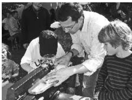
Fingerspitzengefühl war beim Laubsägen gefragt – und auf die Fingerspitzen aufzupassen!