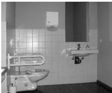
Wurde auch endlich Zeit: Als Ergebnis jahrelangen Spendensammelns konnten behindertengerechtes WC und neue Küche beim Gemeindefest „eingeweiht“ werden.