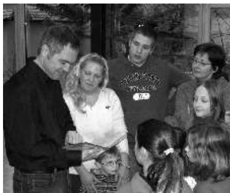
Amts-Zeit: Die HalliGalli-Kinder überreichten am 27.10. Bürgermeister Metz ihr Buch „Was ich tun würde, wenn ich Bürgermeister wäre...“