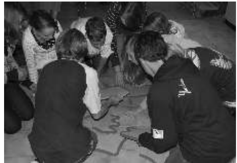
Nur mit Teamgeist ließen sich die Aufgaben lösen, z. B. das Friedenspuzzle (oben) oder die Fragen zu Gott und der Welt bei „1, 2 oder 3“.