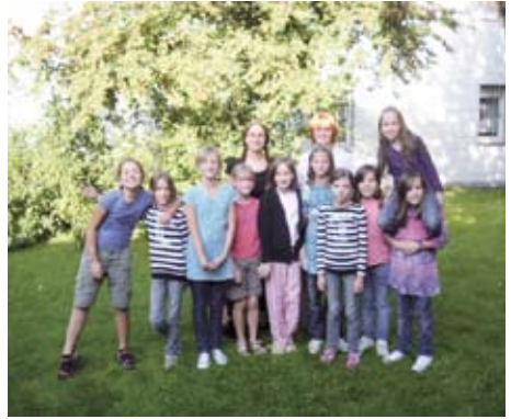
„Nur Mädchen“ posieren hier gutgelaunt im August vor der Sommerpause von „Girls Only“ auf dem Rasen hinter dem Gemeindehaus.