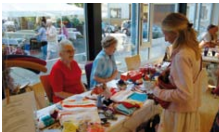
Selbstgebasteltes für Jung und Alt