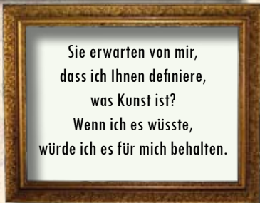
Picasso (oben), der bekannteste Maler des 20. Jh., darunter seine „Kunstdefinition“