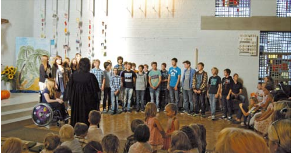
Das erste Mal vor der Gemeinde: Die 28 neuen Konfirmandinnen und Konfirmanden beim Gemeindefest

B eim Gemeindefest am 2. Oktober wurden sie der Gemeinde vorgestellt: unsere neuen Konfirmandinnen und Konfirmanden.