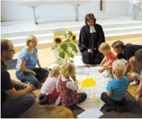
Der Krabbeldienst am 7. August stand unter dem Motto „Das Sonnenlied“. Und die Sonne spielte offensichtlich auch gleich eine mehrfache Rolle.