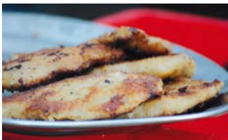
Zugegeben: Schonkost geht anders ... Aber lecker!