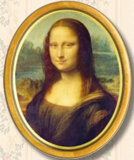
Die Monalisa von Michelangelo: Das bekannteste Kunstwerk?