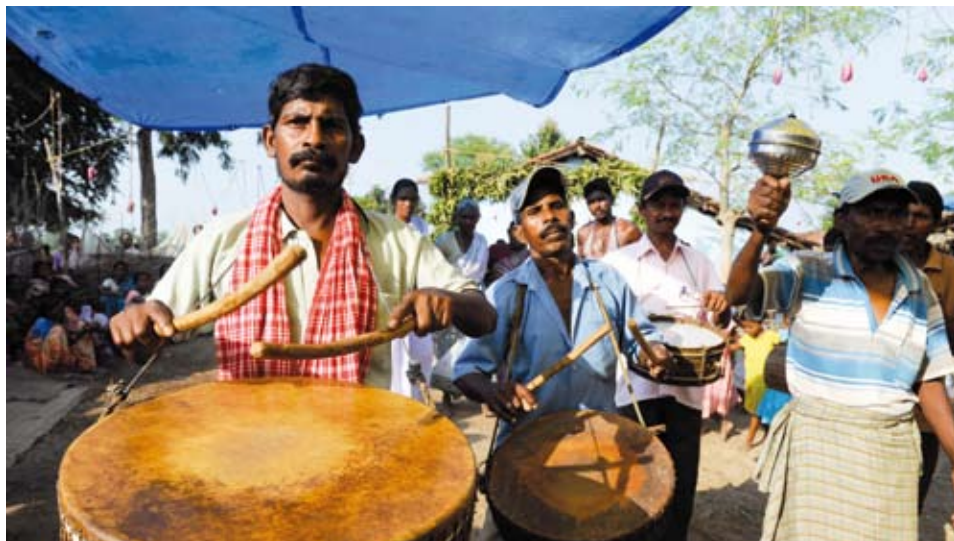
Indien: Proteste der Ureinwohner gegen Enteignung und Landraub