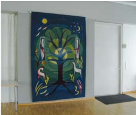
Der Gemeindesaal ist renoviert! So ergab sich für den Wandteppich (oben) ein geeigneteres Plätzchen als die Altarwand in der Kirche; auch die schicke neue Holztrennwand und die Akustikpaneele an der Decke können sich sehen lassen (unten).