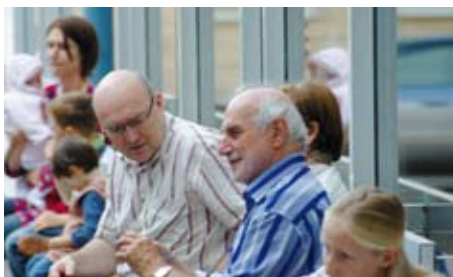
Auf dem sonnigen Kirchvorplatz lauschten viele entspannt dem Klang der beiden Gitarren (unten).