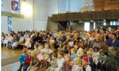
Eine vollbesetzte Kirche beim Gottesdienst