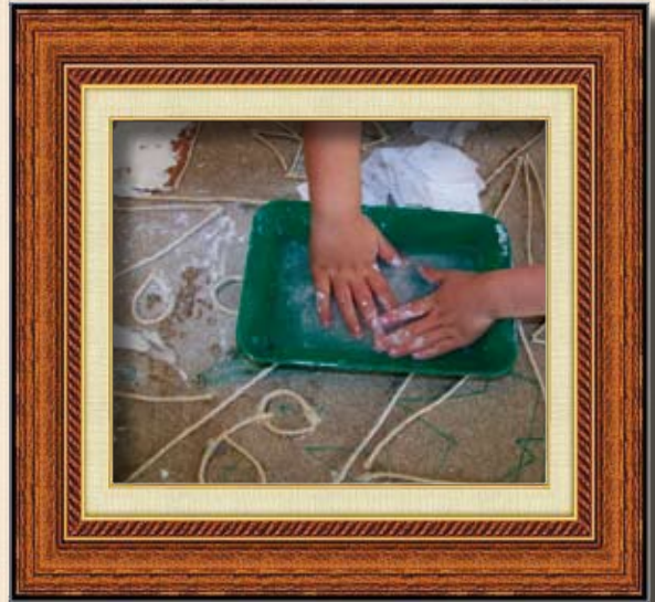
Kunst ganz praktisch: Ohne Hinlängen geht es nicht

von 200,— EURO. Der erste Teilschritt hat vor Kurzem schon begonnen. Gemeinsam mit den Kindern gestalten wir Gips-Farben-Gemälde. Die fertigen Kunstwerke werden dann in einer Premieren-Vernissage im Kinderhaus Sonnenburg ausgestellt.