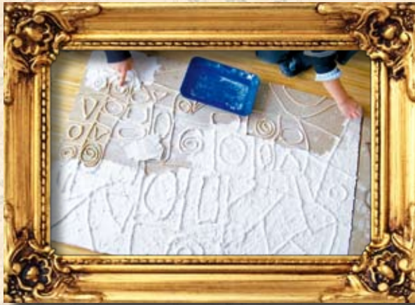
Aus Schnur und Gips entstehen Meisterwerke in der Sonnenburg